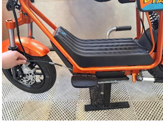
Vedä takajarruvaijerin pää irralleen.