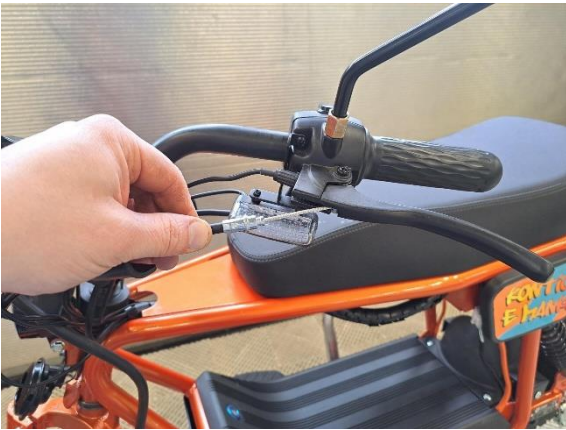
Irrota takajarruvaijerin toinen pää takajarruvivusta.

Uuden osan asennus käänteisessä järjestyksessä.