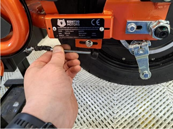
Vedä takajarruvaijerin pää pois takajarruvaijerin kannakkeesta.